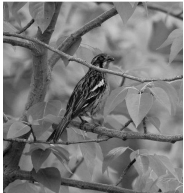
Fig. 1. Macho de Phytotoma rara posado sobre álamo en Estancia Beatriz, Isla Riesco (noviembre 2015).

Los ejemplares observados en la Estancia